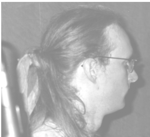
»Frankie« – der Perkussionist von AOK!